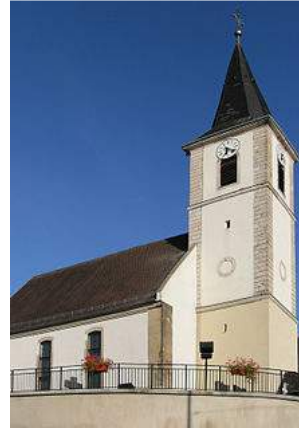
Hoch über Wolschwiller thront die Kirche St. Mauritius