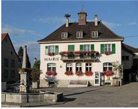
Mairie von Wolschwiller